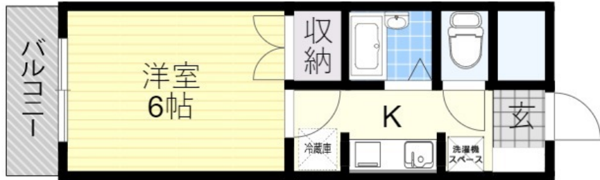
※図面と現況が異なる場合は、現況を優先いたします。