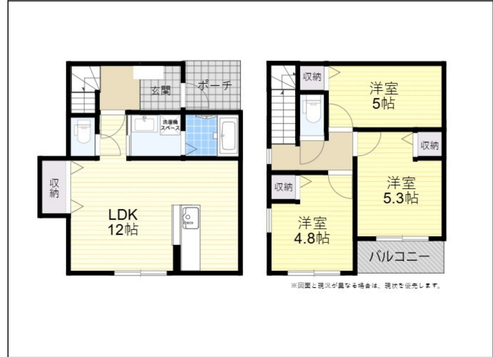
※図面と現況が異なる場合は、現況を優先します。