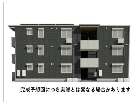
完成予想図につき実際とは異なる場合があります