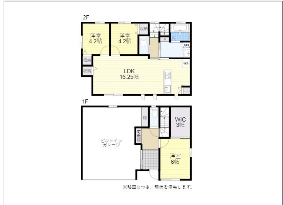
※略図につき、現状を優先します。