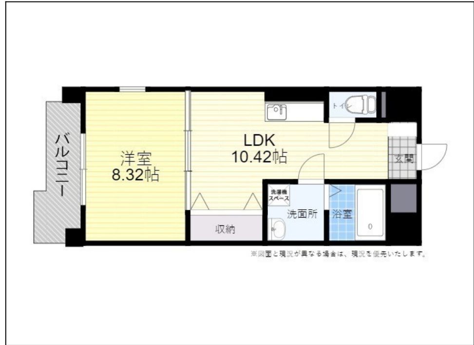
※図面と現況が異なる場合は、現況を優先いたします。