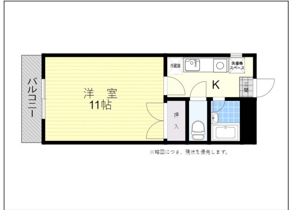
※略図につき、現状を優先します。