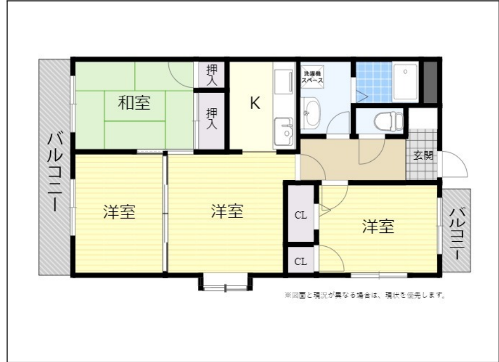
※図面と現況が異なる場合は、現況を優先します。