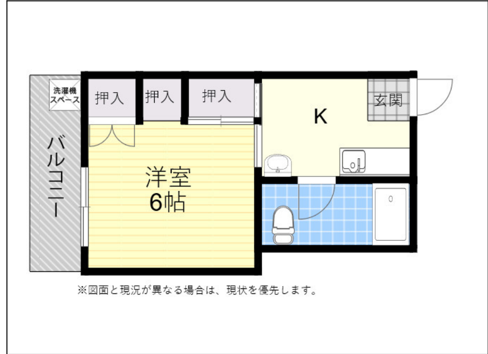
※図面と現況が異なる場合は、現況を優先します。