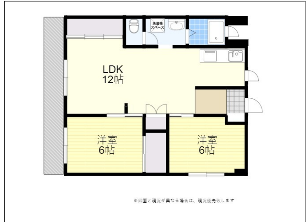
※図面と現況が異なる場合は、現況優先致します