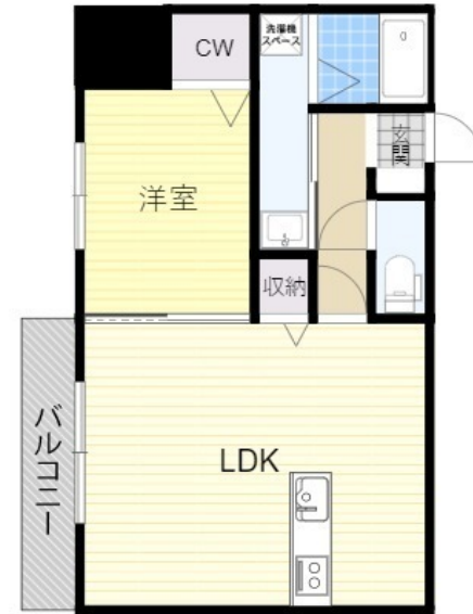
※略図につき、現状を優先します。