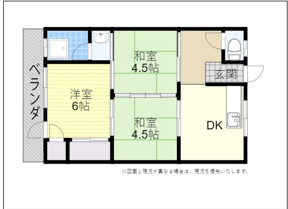
※図面と現況が異なる場合は、現況を優先いたします。