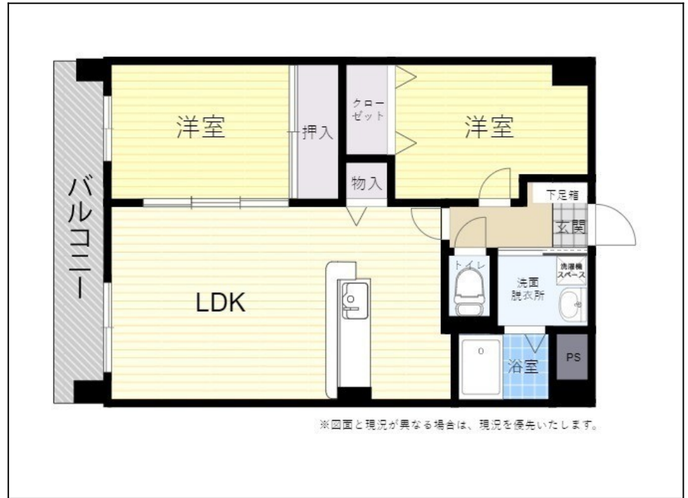
※図面と現況が異なる場合は、現況を優先いたします。