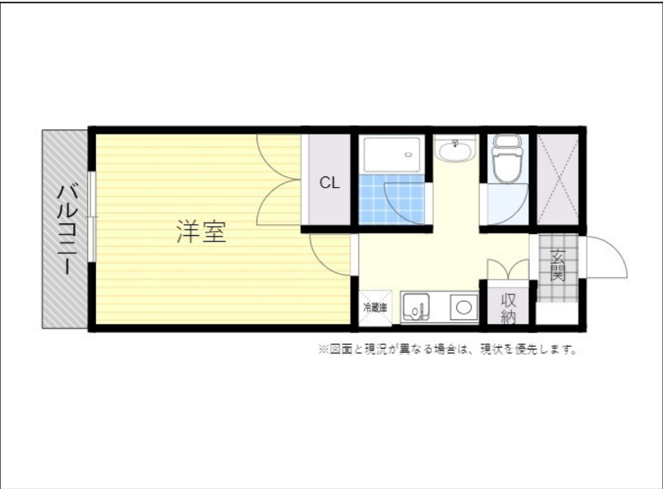
※図面と現況が異なる場合は、現況を優先します。