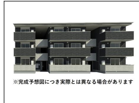
※完成予想図につき実際とは異なる場合があります