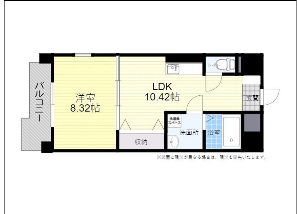
※図面と現況が異なる場合は、現況を優先いたします。