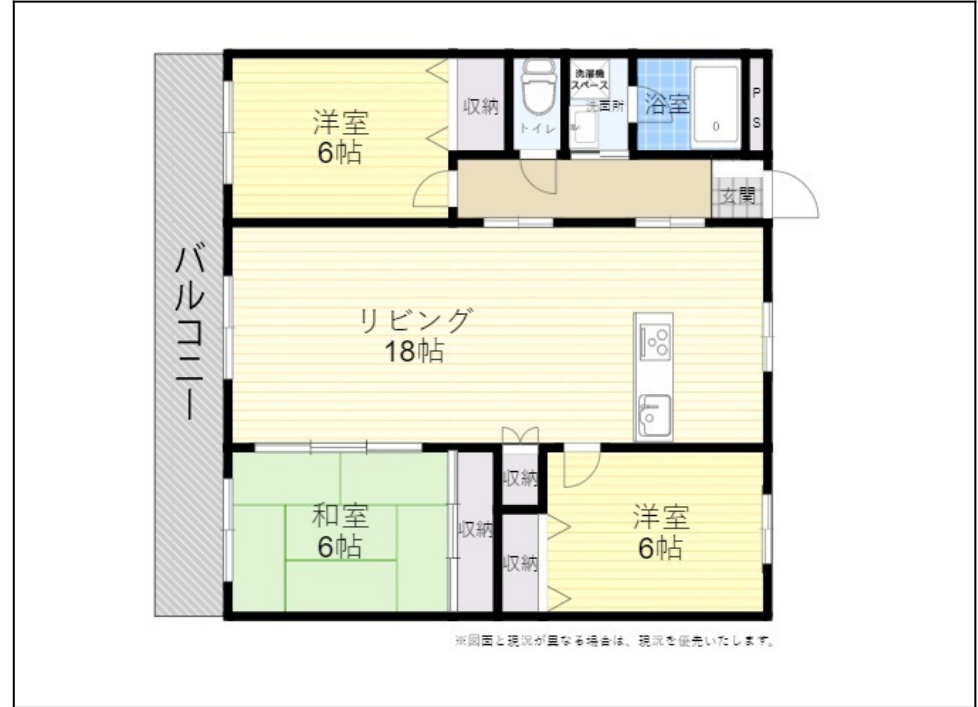
※計画と現況が異なる場合は、現況を優先いたします。