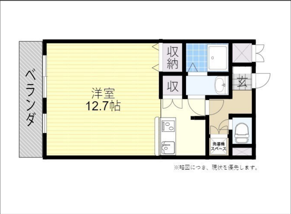
※略図につき、現状を優先します。