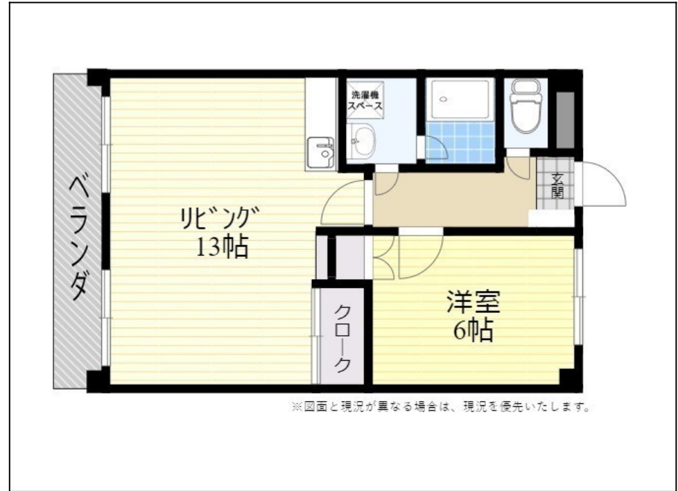
※図面と現況が異なる場合は、現況を優先いたします。