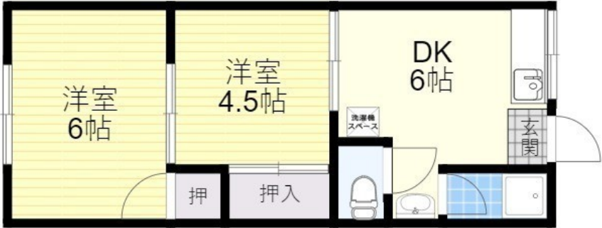
※図面と現況が異なる場合は、現況を優先します。