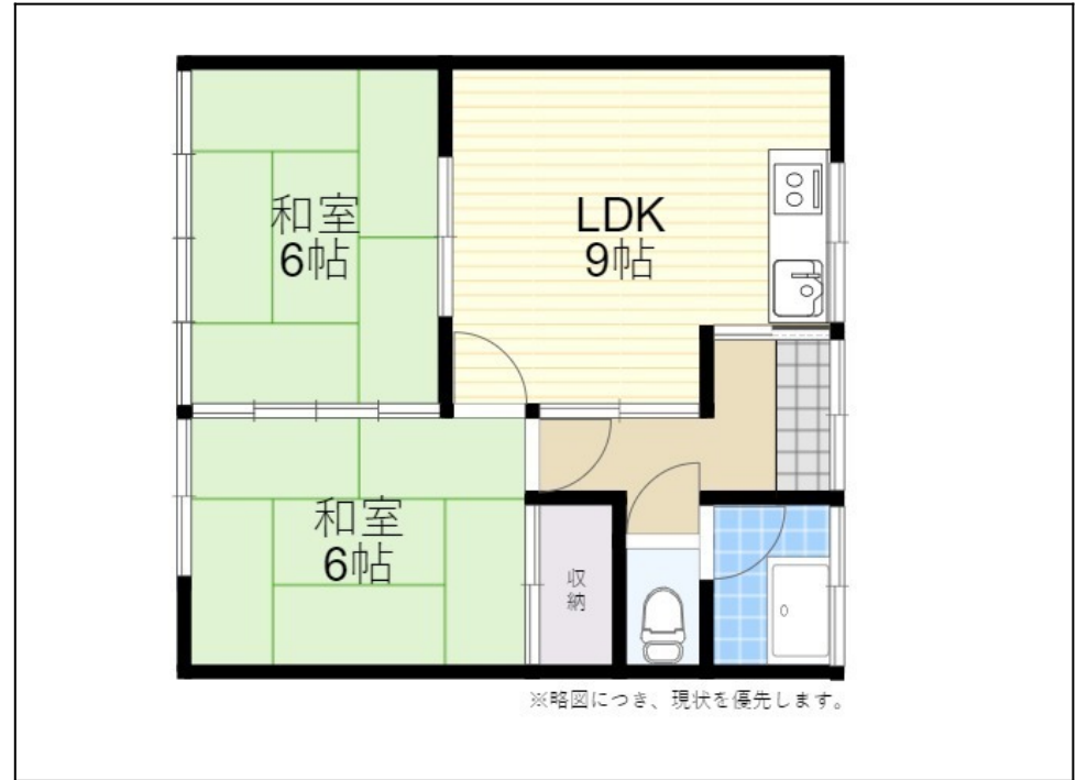
※略図につき、現状を優先します。