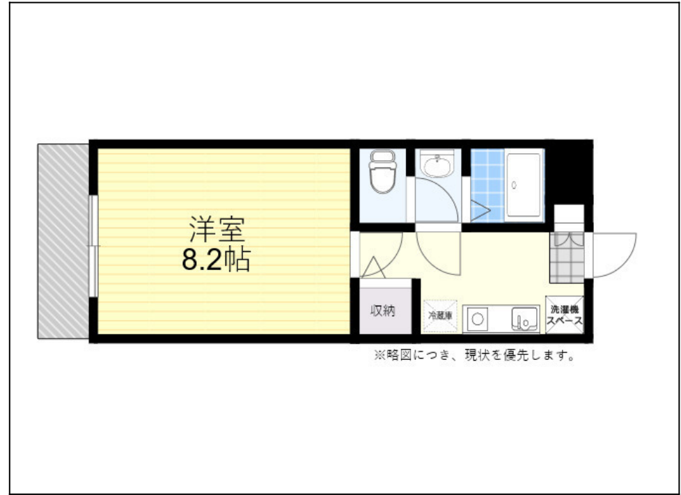
※略図につき、現状を優先します。