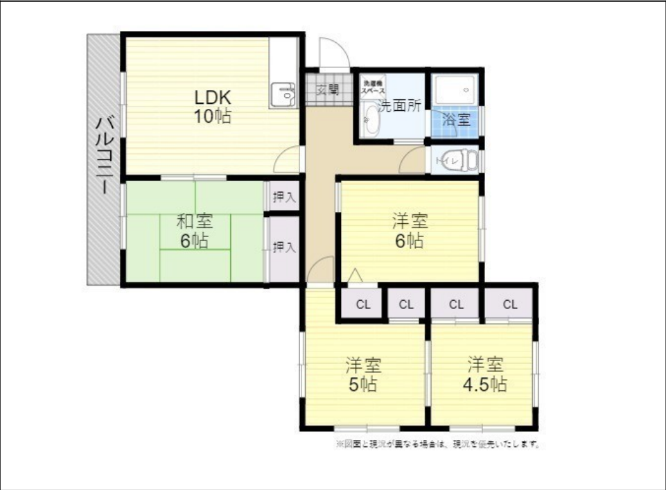
※図面と現況が異なる場合は、現況を優先いたします。