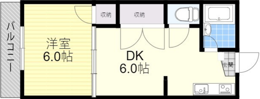
※略図につき、現状を優先します。