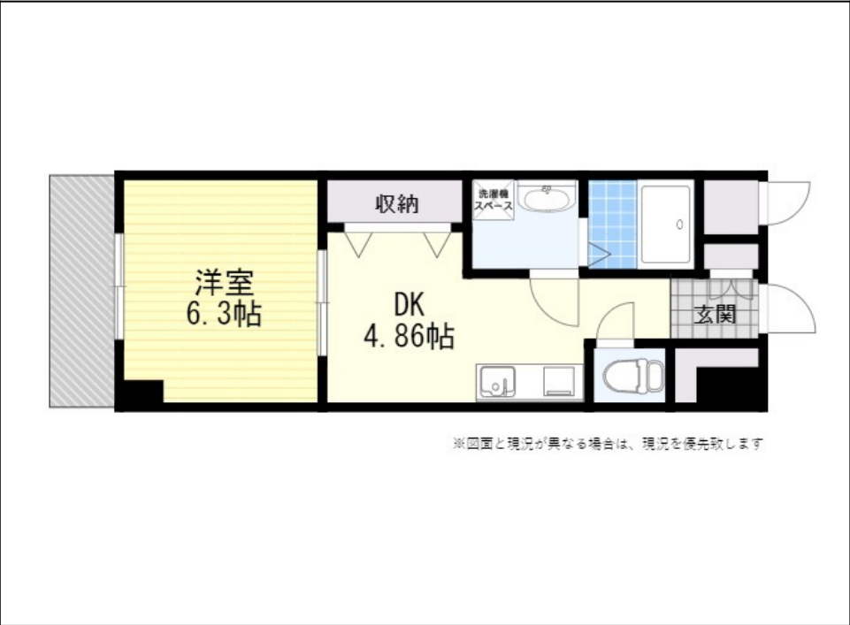
※図面と現況が異なる場合は、現況を優先致します