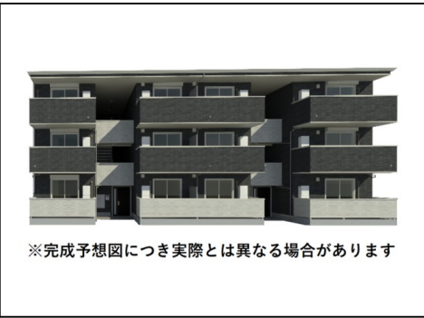
※完成予想図につき実際とは異なる場合があります