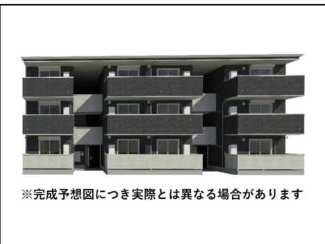
※完成予想図につき実際とは異なる場合があります