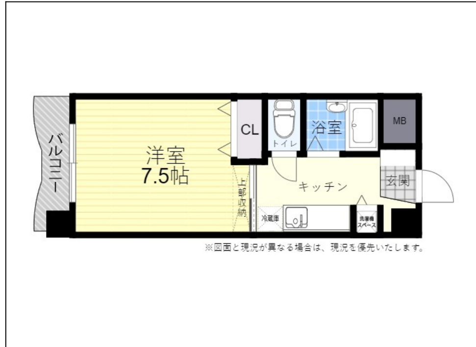
※図面と現況が異なる場合は、現況を優先いたします。