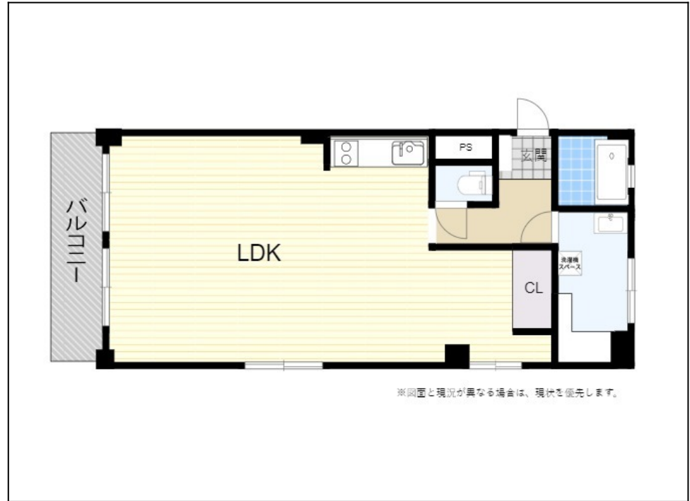
※図面と現況が異なる場合は、現況を優先します。