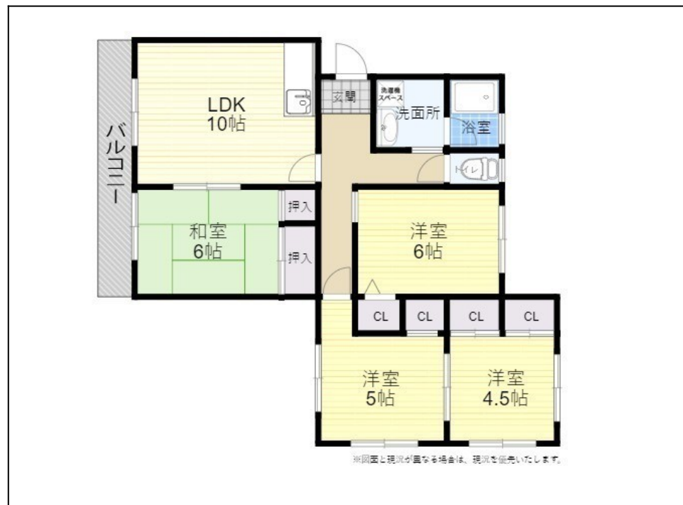
※図面と現況が異なる場合は、現況を優先いたします。