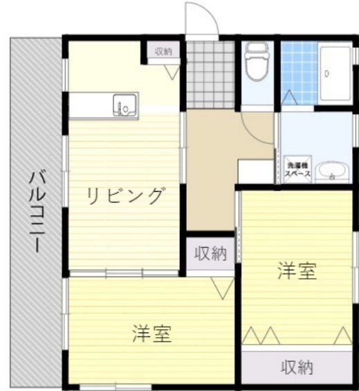
※略図につき、現状を優先します。