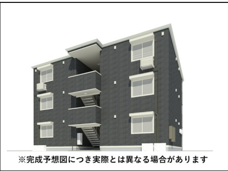
※完成予想図につき実際とは異なる場合があります